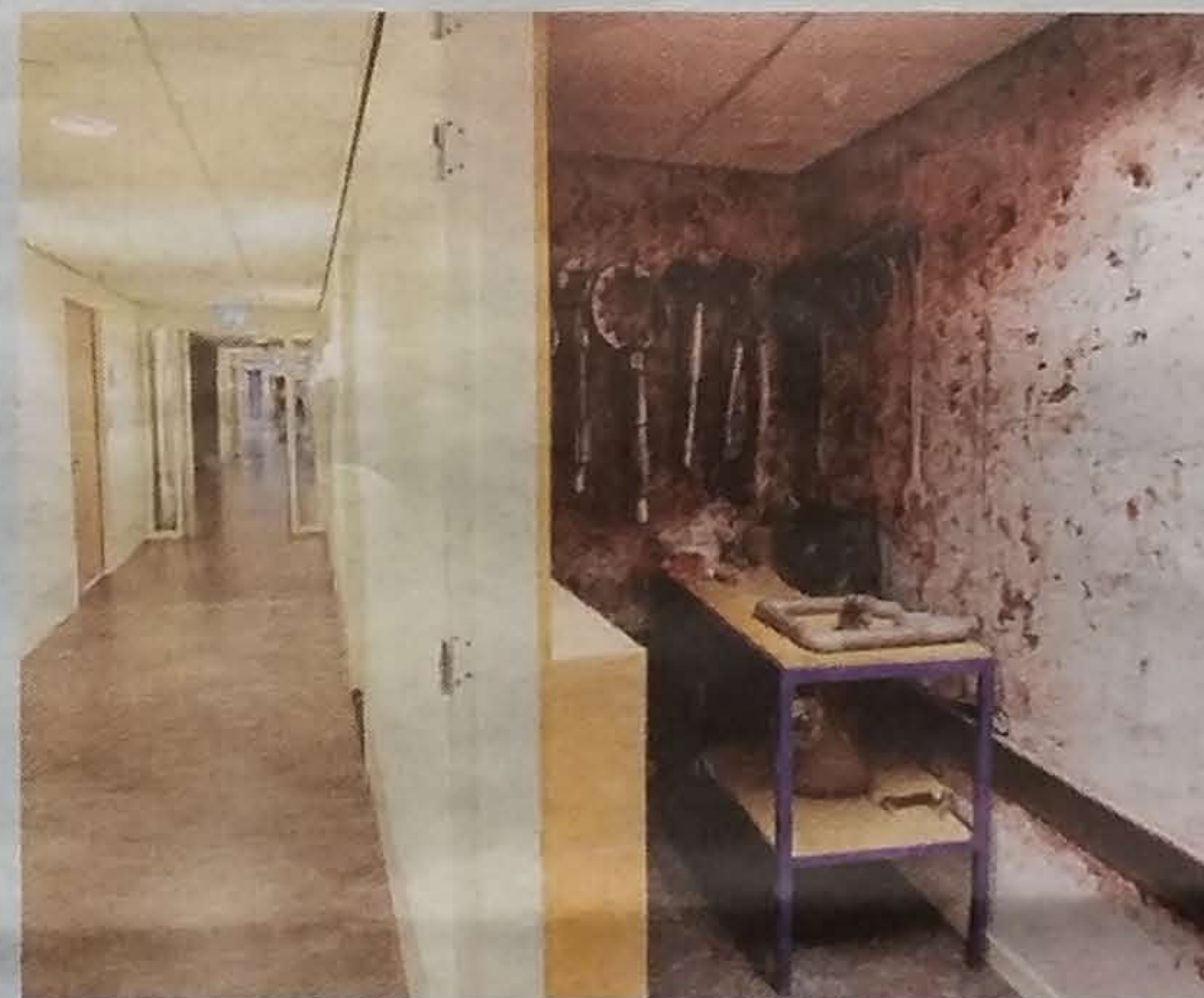
• Een werkbank met materialen en foto's van gereedschap.